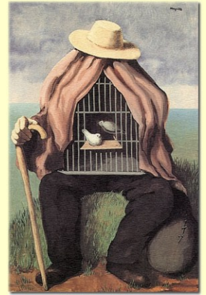
René Magritte le thérapeute

Le Groupe Régional Franche-Comté de la Convention Psychanalytique vous propose, depuis 2018, une série de présentations d'ouvrages en compagnie de leurs auteurs. Le mode privilégié sera celui du témoignage, qui seul rend compte de la vérité d'un sujet à travers son énonciation singulière. Après une présentation du livre par son auteur, une discussion s'engagera avec les participants et le soutien des membres du GRFCCP.